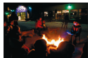
LONGYEARCITY-MARSJEN OG TORGARRANGEMENT