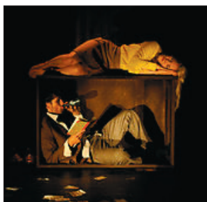
THE BORDER med Jo Strømgren Kompani.

Kl. 20.00 ❖ THE BORDER (GRENSEN) MED JO STRØMGREN KOMPANI - En mann og en kvinne deler en arbeidsplass. De har en gjensidig respekt for hverandre, men under overflaten utspilles en territorial kamp. Paret kjemper også en kamp mot følelsesmessig avhengighet, både overfor hverandre, spillet og den farlige blandingen av disse som ofte preger våre konflikter med det motsatte kjønn. Hovedscenen, Longyearbyen kulturhus. Billetter a kr 190 (voksen)/kr 150 (honnør/student/barn). Billetter selges via www.lokalstyre.no eller i Rabalder kulturkafé.