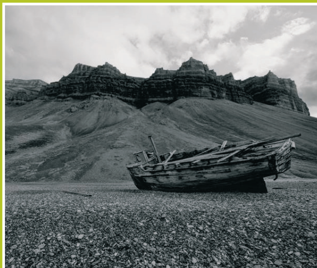
Fotoutstilling med Pål Laukli - Arctic Bay Galleri

Et kulturelt pausesignal ved inngangen til mørketida!